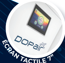
ÉCRAN TACTILE 7"

*normes EN779 : 2012, ISO 16-890 et EN1822